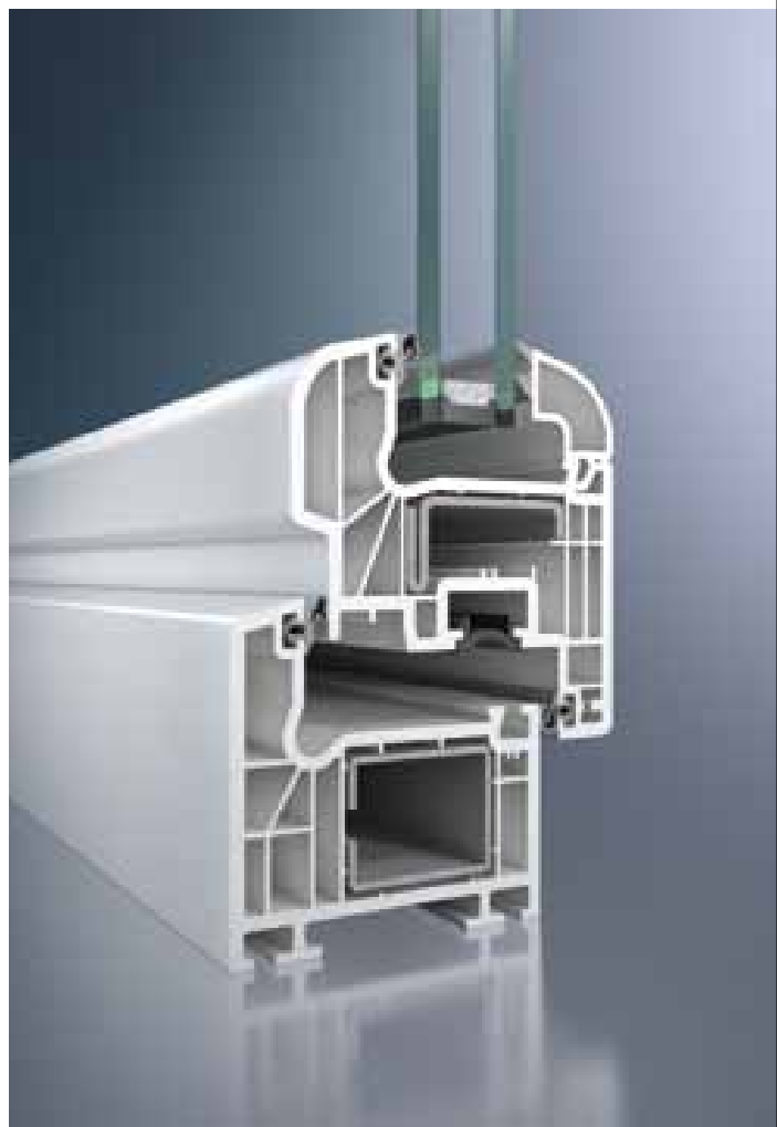
Série CT70 Rondo