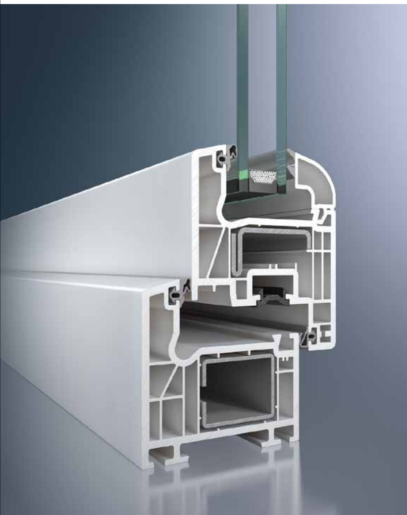
Série CT70 Classic

De ideale oplossing voor kunststof ramen La solution idéale pour les fenêtres en PVC