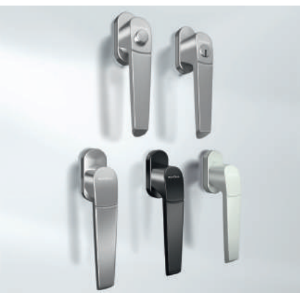
Gamme de poignées : design

Le système de ferrures de haute qualité aux fonctionnalités élevées